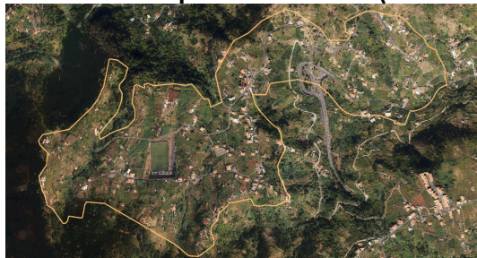
Slika 3: ATV – župa Porto da Cruz (zona Portela i zona Terra Baptista)

Treći i četvrti ATV su u župi Porto da Cruz, u zoni Portela (LS i ruralni turizam) i u zoni Terra Baptista (LS i ruralni turizam) (Slika 3). To su područja koja pokazuju određenu dezertifikaciju, s nekim praznim zgradama kojima je potrebna obnova, gdje su vidljive mnoge izolirane kuće bez sanitarne mreže.