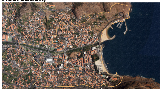
Slika 1: ATV – Urbano rehabilitacijsko područje Machico (engl. Urban Rehabilitation Area of Machio URAM) i luka za rekreaciju (engl. Port of Recreation)