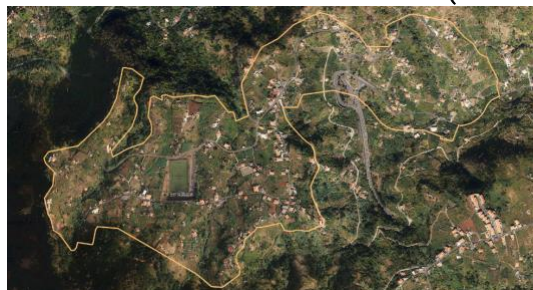
Obrázek 3: ATV – farnost Porto da Cruz (zóna Portela a zóna Terra Baptista)

Třetí a čtvrtá ATV ve farnosti Porto da Cruz, v zóně Portela (MU a venkovská turistika) a v zóně Terra Baptista (MU a venkovská turistika) (obrázek 3). Jedná se o oblasti, které vykazují určitou desertifikaci, s některými prázdnými budovami, které potřebují rekonstrukci, kde je vidět mnoho izolovaných domů bez kanalizační sítě.