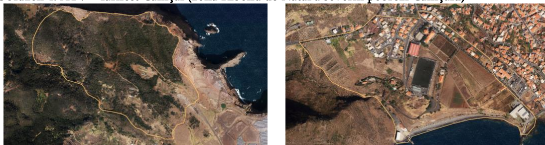
Obrázek 4: ATV – farnost Caniçal (zóna Ribeira do Natal a severní pobřeží Caniçalu)