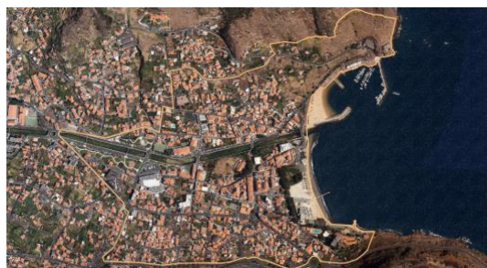
Obrázek 1: ATV – Městská rehabilitační oblast Machico (URAM) a přístav rekreace